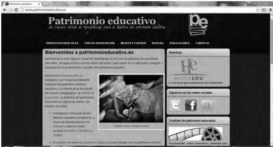
Imatge 1. Espai virtual d'aprenentatge per a la didàctica del patrimoni educatiu <patrimonioeducativo.es>.

de Mestre d'Educació Infantil i Mestre d'Educació Primària 39 de la Facultat de Magisteri de la Universitat de València. La transferència d'uns continguts historicoeducatius propis de l'ensenyament superior a la resta dels nivells del sistema educatiu, així com l'interès mostrat pels futurs mestres en introduir la comprensió de la gènesi i l'evolució de l'educació a la seua futura tasca docent a peu d'aula per fer partícips els seus alumnes del seu passat educatiu, aconsegueix trencar amb l'aïllament del món universitari i obtenir una vertadera transferència del coneixement historicoeducatiu al seu lloc d'origen: l'escola.