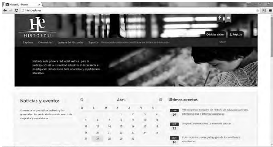
Imatge 2. Espai de col·laboració científic o xarxa social per a la història de l'educació HistoEdu.

ni educatiu ( http://histoedu.es/ ); un espai de col·laboració científica o xarxa social per a la història de l'educació d'acord amb les vies de treball encaminades al desenvolupament d'una Història de l'Educació 2.0 d'acord amb la societat digital. Confiem que aquesta xarxa social gratuïta i sense cap interès comercial ni empresarial, sigui aprofitada pels seus membres per crear grups de treball, projectes, intercanviar interessos, afavorir debats, preguntes i respostes, recursos i esdeveniments, facilitant el treball en xarxa, la col·laboració i participació, així com l'interès d'investigadors, docents i alumnat interessats per la història de l'educació.