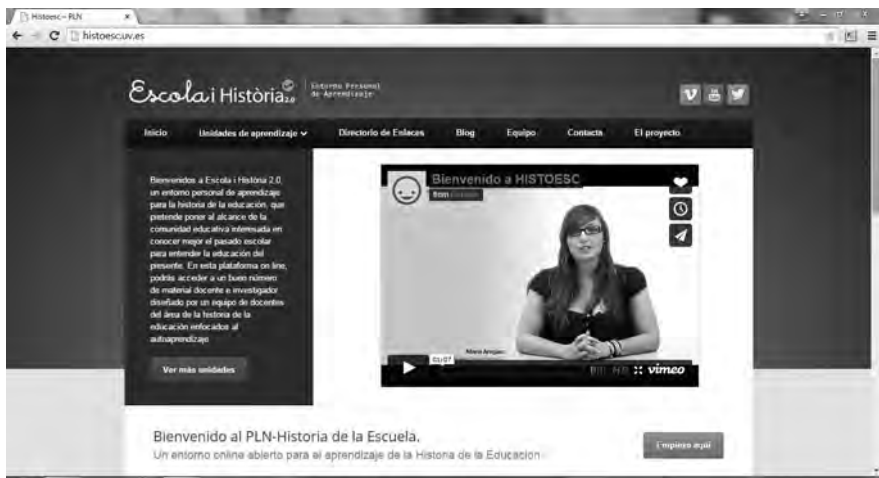
Imatge 3. Entorn personal d'aprenentatge Escola i Història 2.0.

Discursos pedagògics (l'Escola Moderna, les missions pedagògiques de l'ILE, etc.); Política i legislació escolar; Cultura material i pràctiques escolars (espais i condicions materials, propostes d'organització escolar, etc.); La professionalització del magisteri (escoles normals i formació del magisteri); i Modernització i innovacions educatives (moviments de Renovació Pedagògica, MRP). Així, com un exemple del que entenem com a Història de l'Educació 2.0 i Història de l'e-Educació, gràcies a aquestes unitats d'aprenentatge autònom, qualsevol interessat en la història de l'educació (sense tindre necessitat de ser alumne d'un grau de ciències de l'educació), en qualsevol moment i espai, pot treballar i aprofundir en aquests continguts historicoeducatius, rebre un feedback de la resta de la comunitat educativa i augmentar la difusió i els possibles destinataris d'una tasca docent que trenca amb els límits físics i temporals de l'aula universitària i arriba fins a qualsevol lloc amb connexió a Internet.